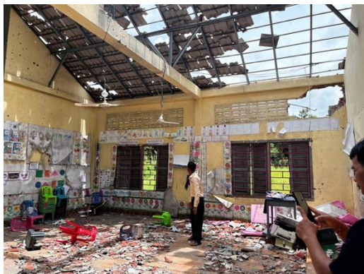
Timeline Dec. 16 border fighting, according to Cambodia